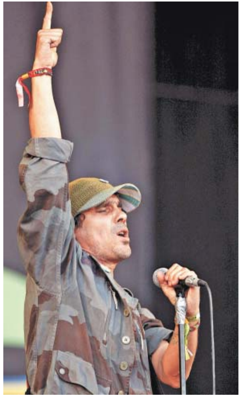
FRANTZESCO KANGARIS/EFE - 28/6/2008

Os shows no Brasil não estavam planejados, foi tudo montado muito rápido, segundo Manu. Ele e sua banda estão encerrando a turnê, que passou pela Europa, pelos Estados Unidos e México, onde os shows foram filmados e certamente vão virar